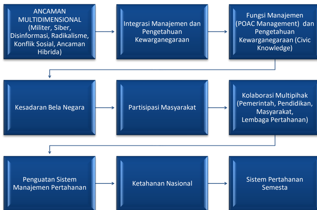
Gambar 2. Sintesis Hasil Penelitian Integrasi Manajemen dan Pengetahuan Kewarganegaraan terhadap Penguatan Pertahanan Negara

Hasil penelitian mengonfirmasi bahwa penguatan sistem manajemen pertahanan negara memerlukan keterpaduan antara tata kelola organisasi dan pengembangan kapasitas kewarganegaraan masyarakat. Temuan ini sejalan dengan pendapat Aris et al. (2022) yang menyatakan bahwa kemampuan bela negara harus dibangun melalui pemahaman yang komprehensif mengenai nilai-nilai pertahanan dalam kehidupan berbangsa dan bernegara. Selain itu, Inggisa Cendra Prakesti (2022) menjelaskan bahwa nasionalisme dan karakter kebangsaan merupakan fondasi utama dalam membangun ketahanan nasional yang berkelanjutan. Dengan demikian, sistem pertahanan yang kuat tidak hanya bergantung pada kekuatan fisik dan teknologi pertahanan, tetapi juga pada kualitas warga negara yang memiliki kesadaran kebangsaan, tanggung jawab sosial, dan komitmen terhadap kepentingan nasional. Integrasi manajemen dan pengetahuan kewarganegaraan pada akhirnya dapat menjadi model penguatan sistem pertahanan yang selaras dengan konsep Sistem Pertahanan Semesta Indonesia, karena mampu menghubungkan kapasitas institusional negara dengan partisipasi aktif masyarakat dalam menjaga kedaulatan dan keutuhan Negara Kesatuan Republik Indonesia.